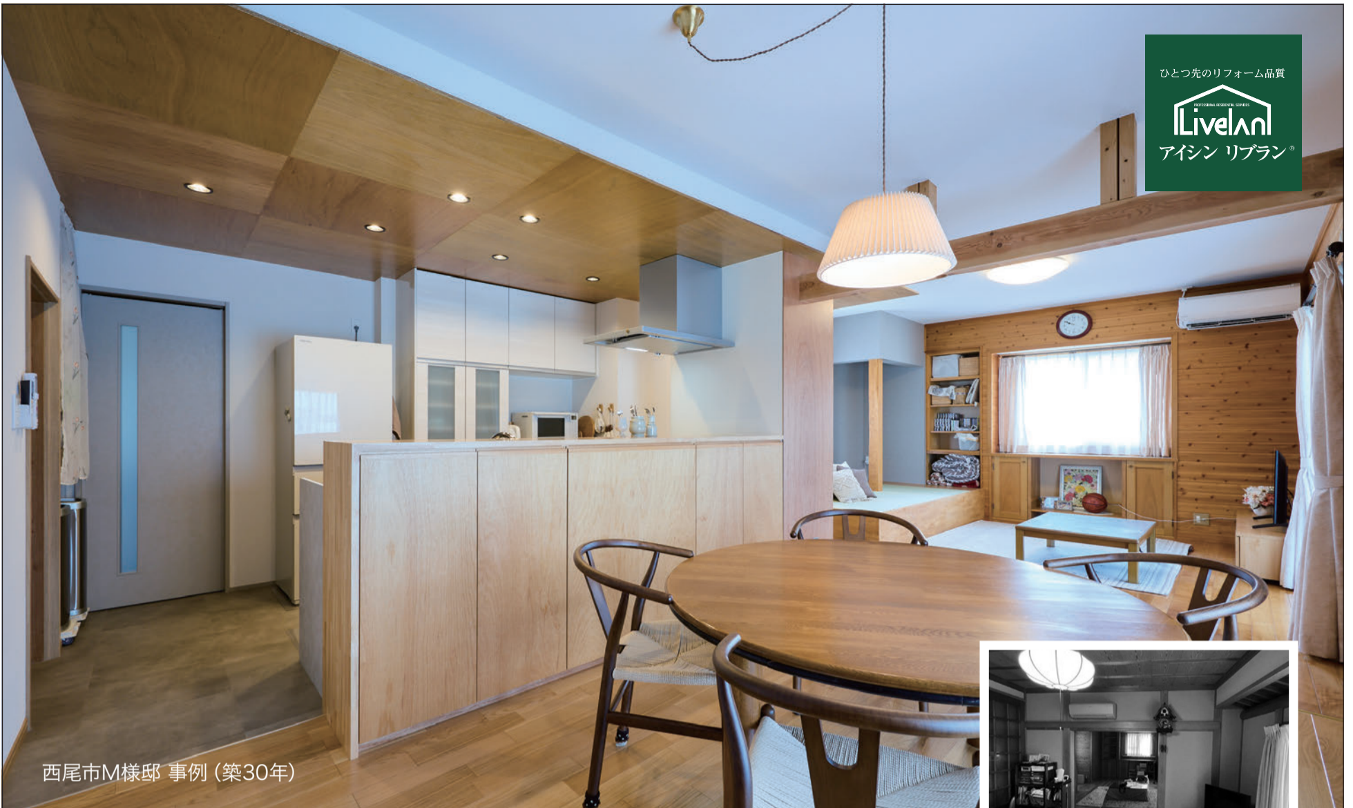
西尾市M様邸 事例 (築30年)