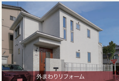
外まわりリフォーム