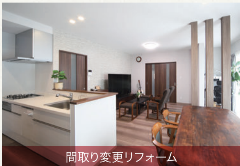
間取り変更リフォーム