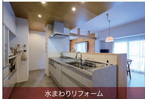
水まわりリフォーム

※現地調査を行い、見積り金額が50万円以上、初回お見積り依頼の方とさせていただきます※キャンペーン主催: アイシンリブラン※AmazonはAmazon.com, Inc. またはその関連会社の商標です