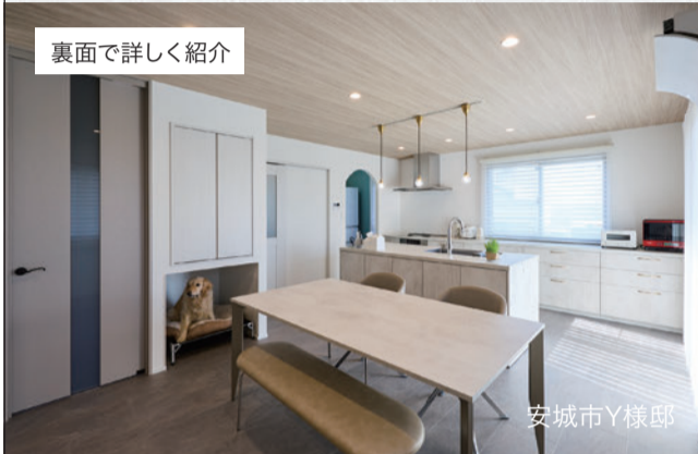
裏面で詳しく紹介

北側から南側へ移動させたLDK。 底冷えするキッチンから解放され 自然光が気持ち良く、とても快適です。