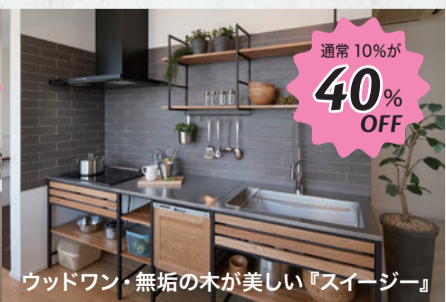
ウッドワン・無垢の木が美しい『スイージー』