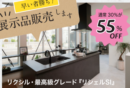
リクシル・最高級グレード『リシエルSI』